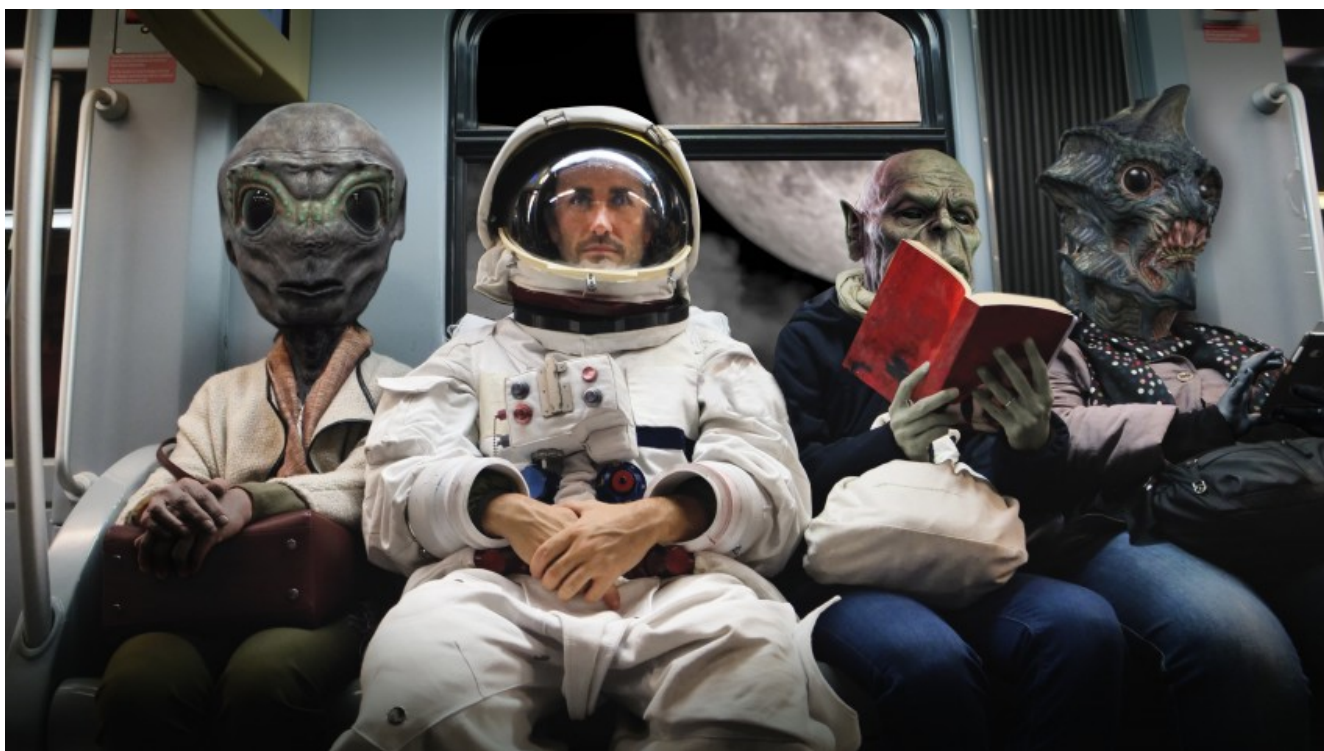
Goed leesonderwijs begint bij boeiende verhalen die de nieuwsgierigheid prikkelen.