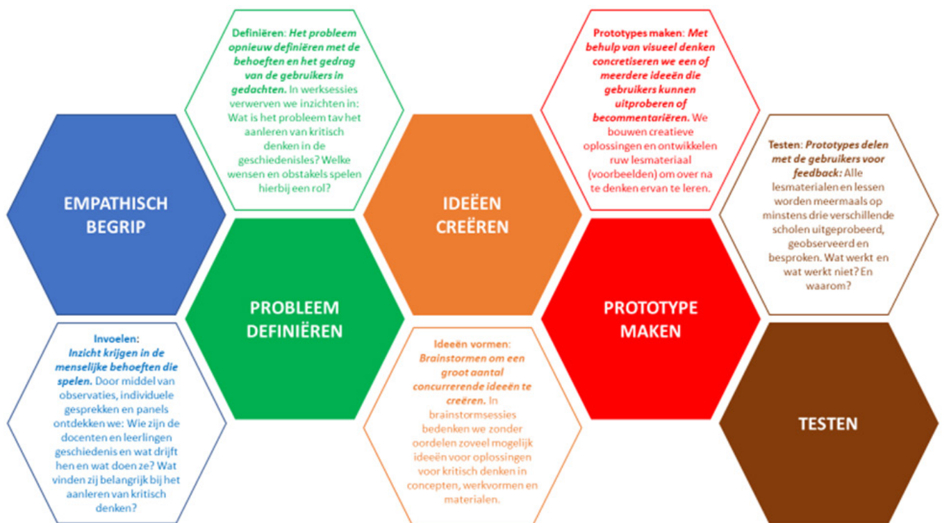
Figuur 1. Stappen van het onderzoekstraject op basis van design thinking Blink geschiedenis

samen met docenten en leerlingen aan de hand van prototypes (voorleggen van ideeën, testen en weer bijshaven van werkvormen en materialen) antwoorden op de centrale vraag gezocht. Het heeft geleid tot een aantal didactische designprincipes. Vanaf 2017 tot op heden vindt fase drie plaats waarin het lesmateriaal concreet wordt uitgewerkt op basis van de geformuleerde designprincipes. De verschillende stappen van het onderzoekstraject zien er als volgt uit (zie figuur 1):