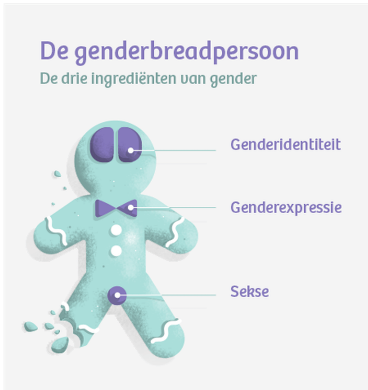
De genderbreadpersoon. Illustratie: De Correspondent

In plaats van een paar hokjes - óf man, óf vrouw óf derde gender - is gender in de praktijk een spectrum met vele tussenvormen. Gender is opgebouwd uit een aantal ingrediënten: genderidentiteit, genderexpressie en sekse.